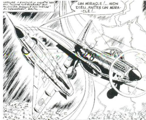
Viñeta de la serie "Michel Tanguy"

Ciertamente, nuestro país no ha sido muy generoso en el reconocimiento del cómic como forma artística. En Francia, sobre todo, y en otros países europeos, éste ha tenido mayor arraigo y prestigio que en España, donde ha quedado relegado a los sótanos del arte. Ese prestigio se fundamenta en el interés que esos países han demostrado hacia los dibujantes y los guionistas que firman los tebeos, en su consideración como autores. El cómic en España tuvo su momen-