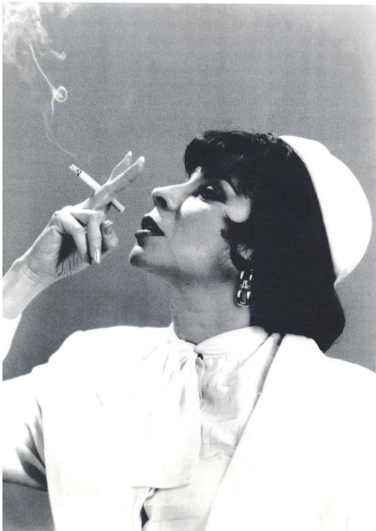
Teatro Pregones (USA)

CELCIT. Desde entonces, siempre han estado con nosotros, preparando los eventos especiales, proponiendo la programación latinoamericana, y sobre todo animándonos a seguir adelante en los momentos difíciles, que no han faltado en la historia del Festival, y apoyando el proyecto donde quiera que se encontraran.