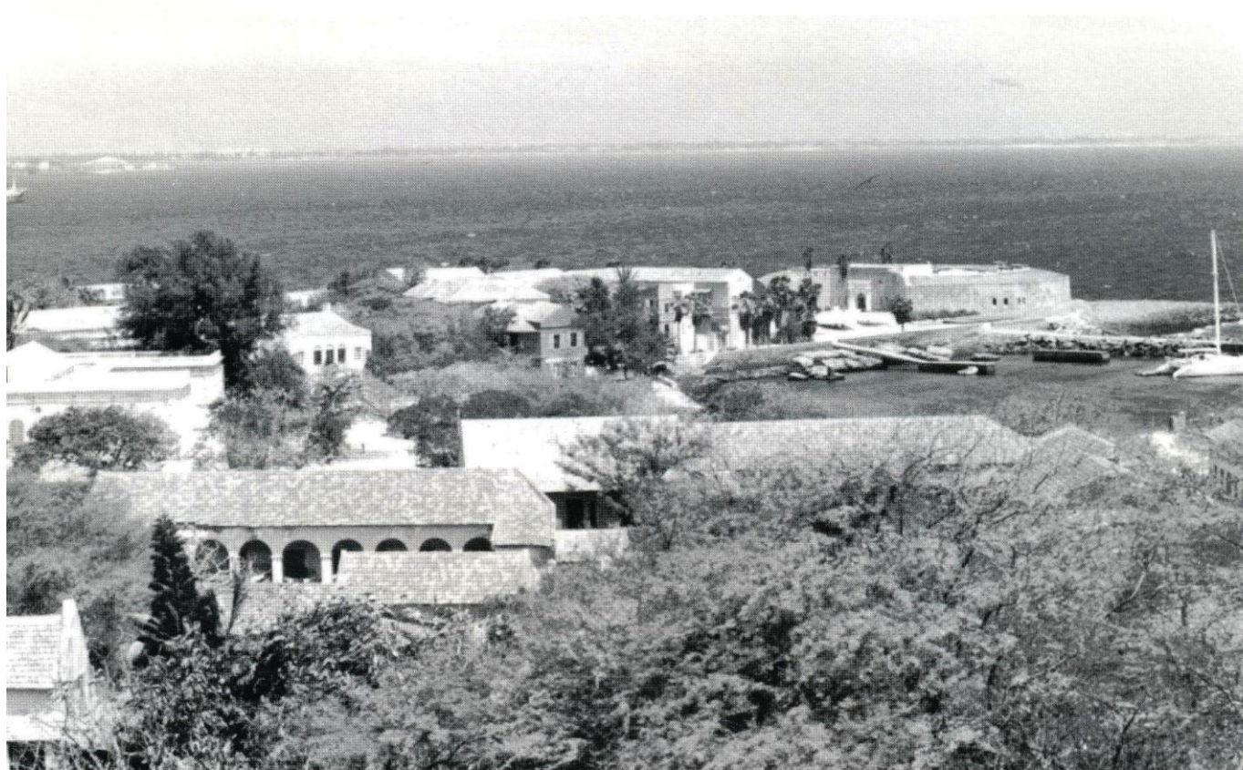
Isle de Foreé. Frente a Dakar

Aprovecha así para disertar un poco sobre el cuento, y así afirma que el cuento es un sociograma que permite la participación de la Asamblea en su conjunto y no sólo el protagonismo de los actores-autores. Sobre la duplicidad psicológica del canario entre dos personalidades distintas y a veces opuestas.