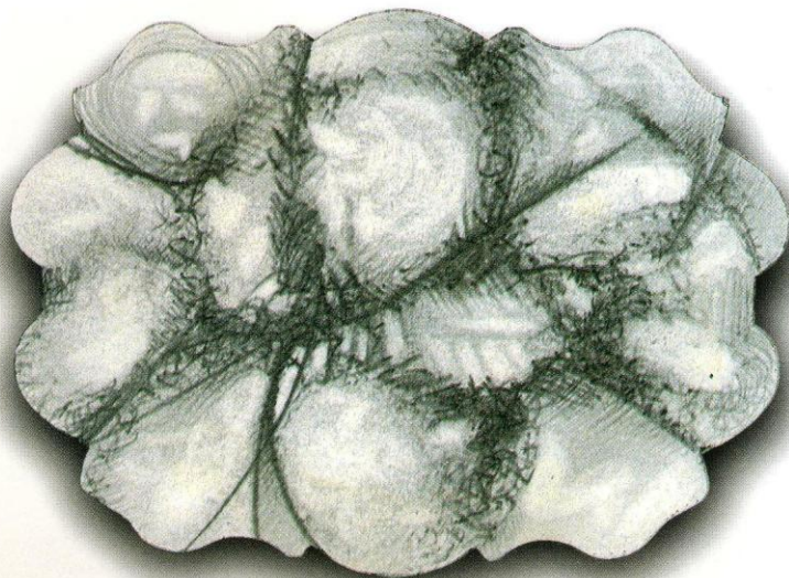
Dibujo latente sobre cartón 11X8 cm. 97-98

"... la sombra como recuerdo (...) el recuerdo del palpitante de la NATURALEZA. (...) Utilizo la sombra como recuerdo de la NATURALEZA, igual que una piel recuerda a un animal."