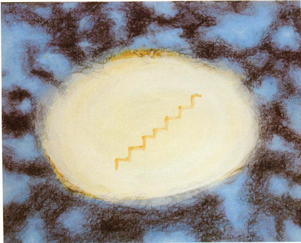
"Entre ayer y mañana" 73X60 cm. 11:20 a.m. 98-99

"Ya no tengo una meta precisa. Estoy empezando a pensar que ahora no es tan importante el objetivo, sino el viaje en sí".